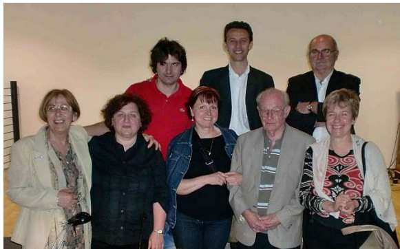
A luglio Maratona di lettura. Gli Incipit.